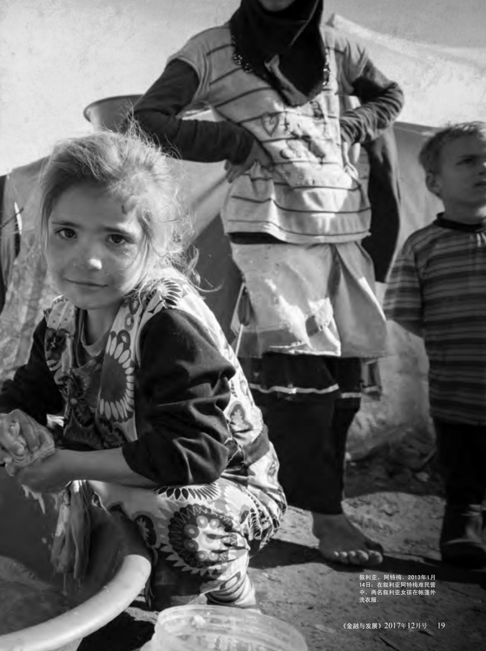
叙利亚，阿特梅，2013年1月14日：在叙利亚阿特梅难民营中，两名叙利亚女孩在帐篷外洗衣服。