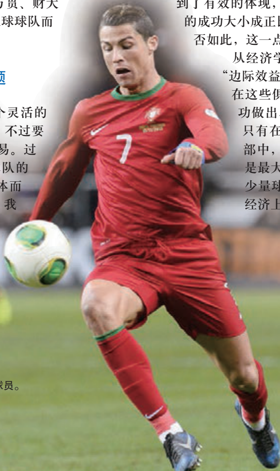
葡萄牙的C罗是全世界薪酬最高的足球球员。

从经济学的角度看，球员应该转会至其“边际效益产品”能够最大化的俱乐部——在这些俱乐部中，球员可以为球队的成功做出尽可能最大的贡献。显而易见，只有在少量属于联赛传统强队的俱乐部中，球员对俱乐部收入的贡献度才是最大的。不过，很多经济学家认为，少量球队始终在联赛中称霸的局面在经济上效率低下。