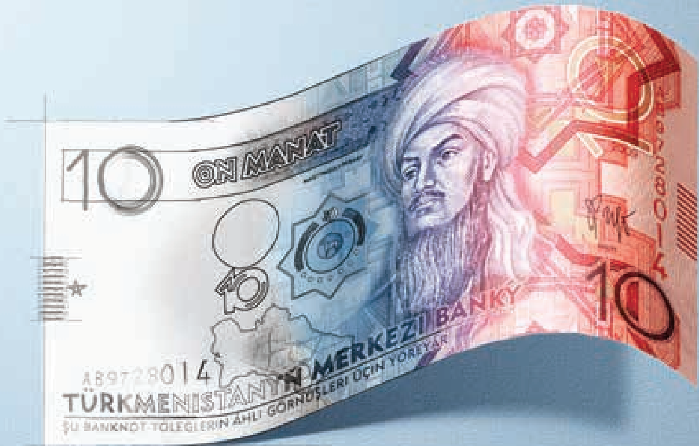
土库曼斯坦新的10马纳特纸币的照片插图，上面绘制着该国著名诗人马格图姆格利·皮勒吉（Magtymguly Pyragy）。