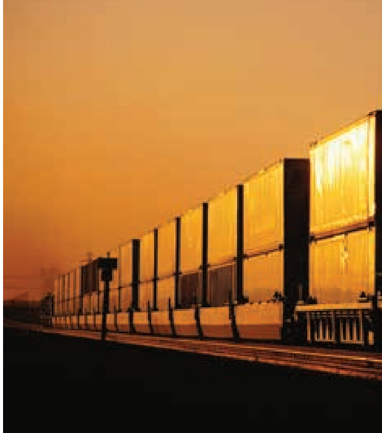
行驶在美国加州达格特附近的货运列车。

尽管存在这种产品选择倾向，但发展中国家仍受益于发达经济体所推行的贸易自由化。随着发达经济体自由化进程的推进和经济的不断繁荣，发展中国家的出口市场也得到了发展壮大。自二战到 1986 年期间，经历了七轮多边贸易谈判，发达经济体贸易自由化促进了市场的成长，也帮助了那些采取因势利导措施的发展中国家。韩国等一些推行外向型经济的东亚国家成功开发了发展中的海外市场，使出口和收入的增速得到显著提高，进而使贫困人口大大减少。而印度等国未能做到这一点。这一对比表明，贸易为各国提供了获利契机，但必须要紧紧抓住机遇。之所以错失良机，通常根源就在于造成国外市场获利低于国内市场的自给自足型经济政策。