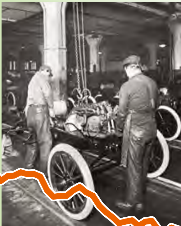
1913年，美国密歇根州福特汽车装配线。