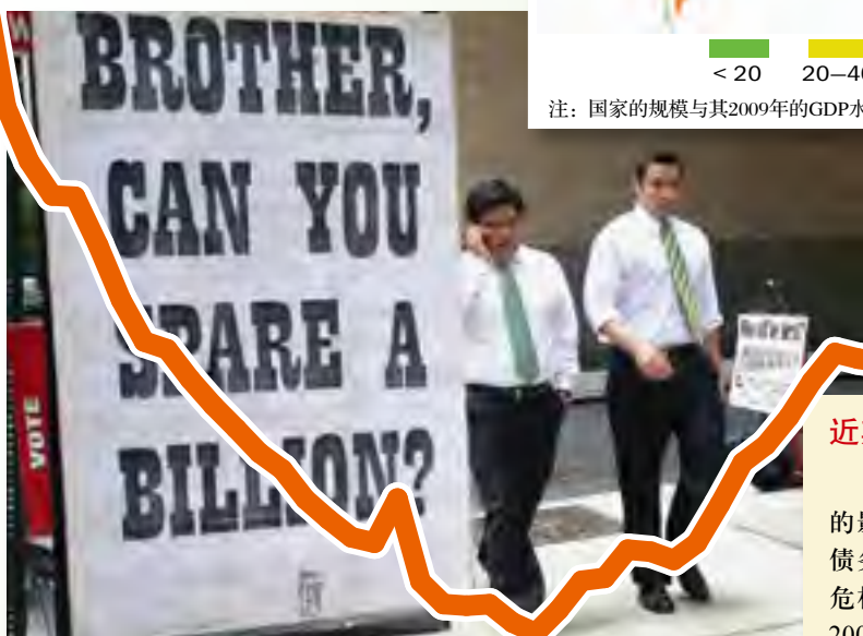
2008年, 美国纽约路边的广告牌。

大萧条期间, 在经历了一系列的银行和货币危机后, 债务与GDP之比在1932年达到峰值——80%。从20世纪30年代中期到末期, 债务下降, 然而随之而来的第二次世界大战使得刚刚有所减少的债务再一次上升。由于很多国家为了为战争融资而大量举债, 因此发达经济体的负债在1946年达到了数据库中所记载的最高纪录——债务与GDP之比约为150%。