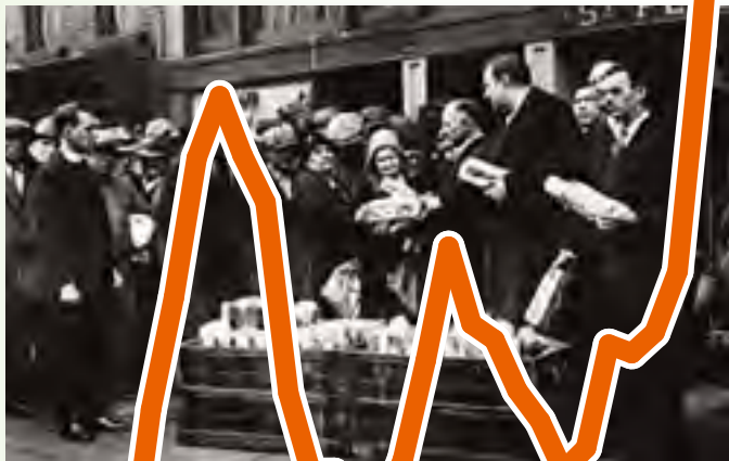
1930年，美国纽约，等待领取免费面包的人排起了长龙。