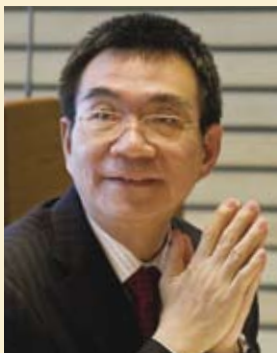
林毅夫，世界银行高级副行长兼首席经济学家。

修改后的贫困统计数字可以增进人们对发展进程的理解，设想你是一个发展中国家的总理，你已经努力工作了多年来改革本国经济以便使经济增长率持续提高，减少贫困。当你正满怀信心认为事情进入了正确的轨道，并且实现新千年发展目标已经有了很清晰的进展时，出乎意料的是，世界银行的一些专家提出的新的计算结果表明，你们国家的最新校正的国际贫困率比过去想象的要高很多。你感到非常震惊，于是你仔细思考，并且要求你的专家仔细检查他们的统计结果。然而同样的，他们重新检验的实证经验证据，证实贫困确实比你想象的要普遍得多。