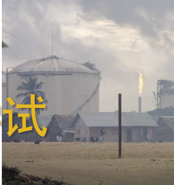
尼日利亚费尼马市渔村旁边的天然气厂。

尼日利亚挥霍了它们20世纪70年代的石油横财，这导致了这个国家30年的经济停滞和公共机构的退化，其主要原因在于不合适的财政和宏观经济政策、腐败和管理不善的共同作用。此外，没有多少国家（甚至经济学家）充分认识到管理石油横财是一件困难的事情。最近的石油价格上涨再次给了尼日利亚一个将“石油资源的诅咒”变成上帝恩赐的机会。它必须从过去的错误中吸取教训，不能再像过去那样以缺乏经验为借口。这个国家为应对近期油价的上涨采取了一些根本性的变革，这是一个良好的开端。但是，对于尼日利亚和整个非洲大陆而言，坚持这些改革至关重要。