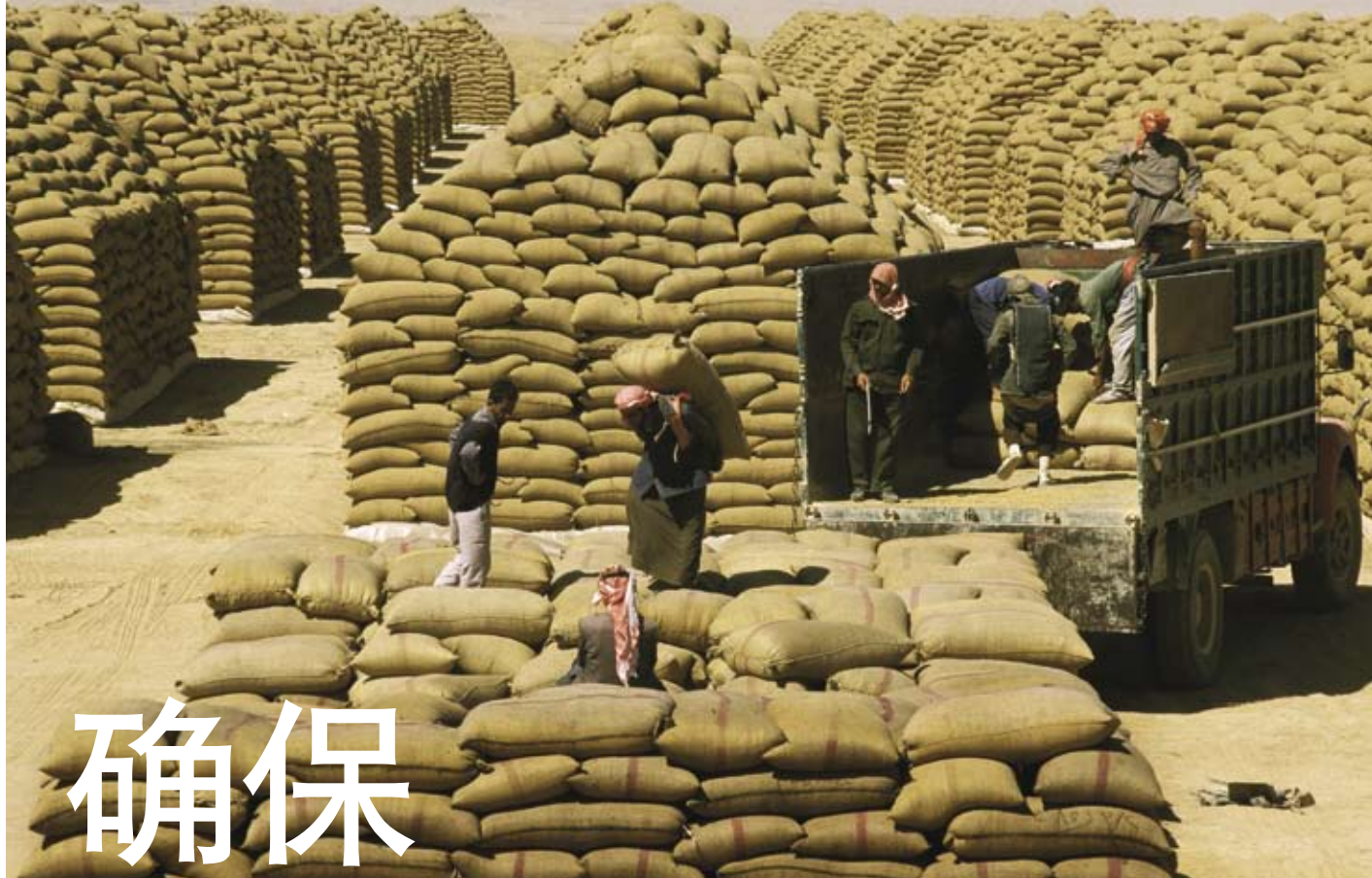
叙利亚哈塞卡米什利附近的麦垛。