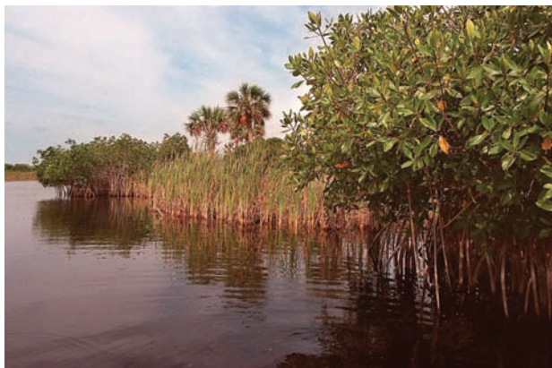
红树林保护沿海地区免受腐蚀、旋风和大风。

红树林这种耐盐的常绿树木可见于沿海地带、咸水湖、河流和三角洲地区，是提供木材、食物、饲料、药材和花蜜的重要的生态物种。这里也是鳄鱼、蛇类、老虎、鹿、水獭、海豚和鸟类等动物的栖息地。澳大利亚、巴西、印度尼西亚、墨西哥和尼日利亚拥有全球红树林总面积的大约50%。