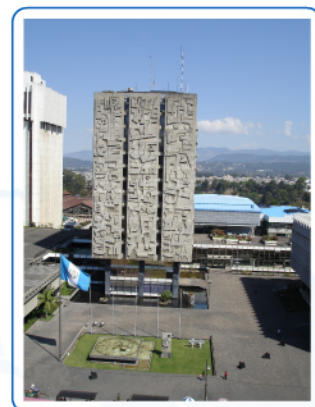
Sede de CAPTAC-DR, Banco de Guatemala, piso 15.