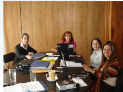
Capacitación del personal administrativo por Rocío Sarmiento, funcionaria del Departamento de Finanzas Públicas del FMI.