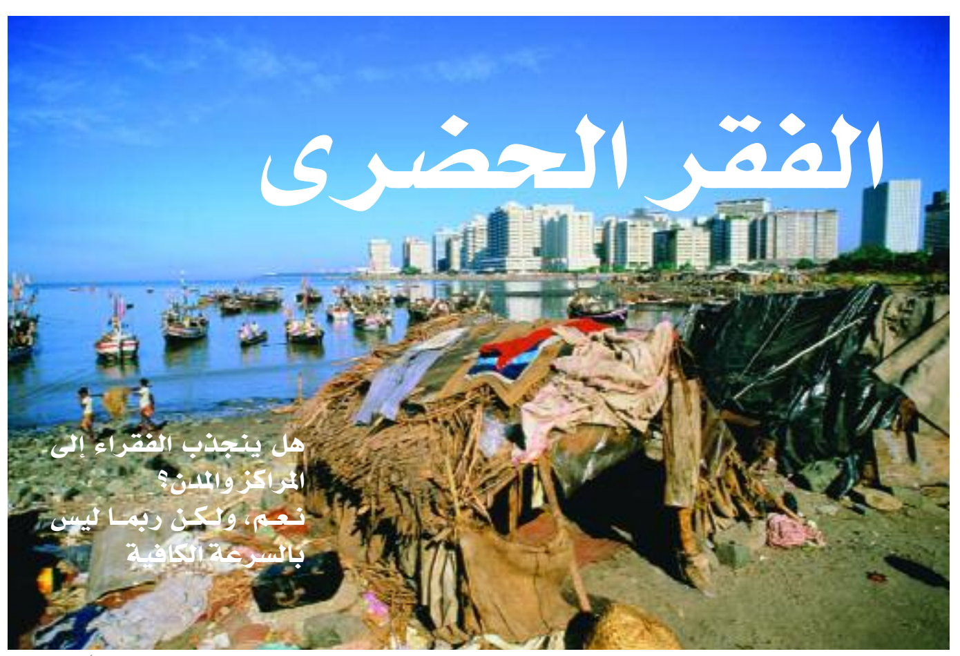
مدينة الأكواخ في مومباي