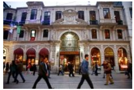
伊斯坦布尔的购物街：一些新兴经济体（如土耳其）需要通过改革降低经济增长对消费的依赖