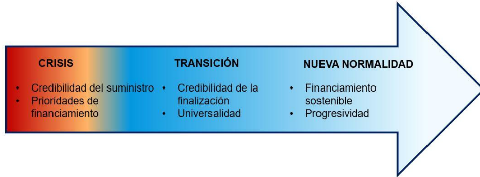
Gráfico 3. Riesgos políticos asociados con las transferencias universales a medida que evoluciona la crisis