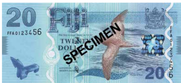
Arriba: El billete de 100 dólares fijianos, con la cigarra endémica del país. Abajo: En el billete de 20 dólares fijianos aparece el pájaro kakau ni Gau volando.

nadie hablaba de las nanai , por ejemplo, pero el año pasado los periódicos publicaron artículos cuando los insectos reaparecieron”.