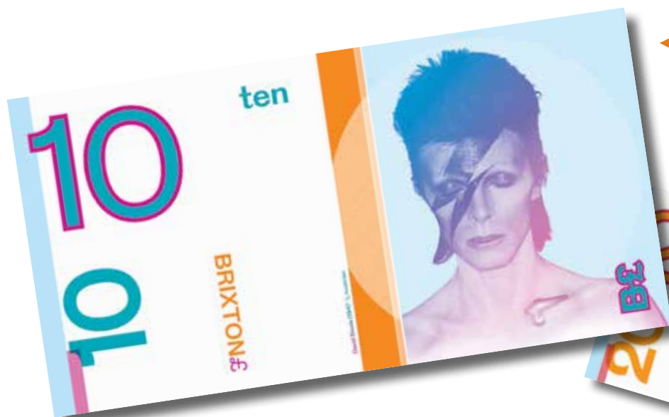
◀ La imagen de David Bowie en la portada del álbum "Aladdin Sane" en el billete de B£10.