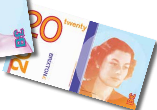
Violette Szabo, agente secreta británica durante la Segunda Guerra Mundial, en el billete de B£20. ▼