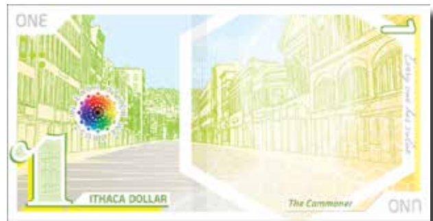
El diseño del próximo billete del dólar de Ithaca presenta la plaza de la ciudad.